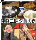
津軽三味線夕食の例