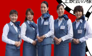
津軽半島観光アテンダント