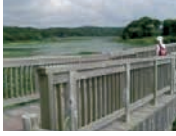
↑大沢内ため池公園

津軽鉄道10番目の駅です。有人時代の駅舎が残されており、4番目の駅「津軽飯詰」によく似た形の駅舎になっています。駅の中は有人駅だった当時の雰囲気が今も残っているのと同時に、駅舎の周りに植えられた草花はいつも綺麗に手入れがされており、いつでも暖かな雰囲気を感じられる駅です。